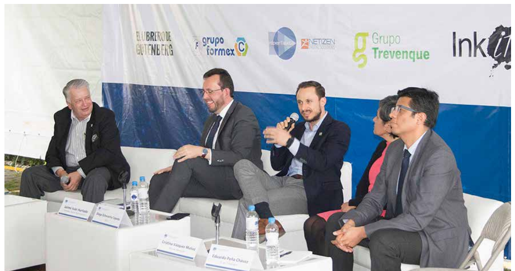
“La importancia de los metadatos en la nueva industria editorial”, uno de los temas abordados durante el encuentro.

“Durante la II Feria de Innovación y Soluciones Tecnológicas para la Industria Editorial, los asistentes establecerán contacto directo con empresas que ofrecen propuestas innovadoras a los diferentes aspectos del quehacer editorial. Tanto las pláticas, como los