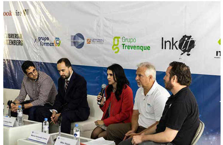
Con gran entusiasmo participaron expositores y editores.

Fue así como ejecutivos de niveles medio y alto, directores y/o directoras generales, coordinadores, gerentes de sistemas, comerciales o de ventas y del área de producción y edición de contenidos provenientes de empresas editoriales, distribuidoras, librerías e instituciones académicas tuvieron la oportunidad de intercambiar opiniones y realizar consultas directamente con los proveedores.