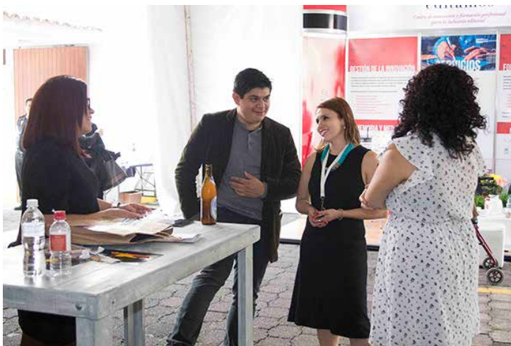
Más de 170 profesionales de la industria editorial se dieron cita en esta II Feria de Innovación y Soluciones Tecnológicas para la Industria Editorial.