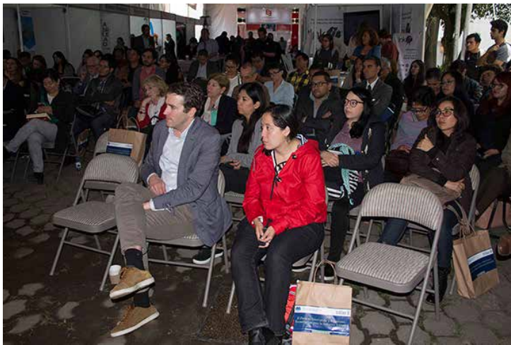
Con este tipo de eventos, la CANIEM busca vincular al gremio editorial con empresas de innovación para el sector.

Dichos temas fueron: la innovación en la industria editorial; comercio electrónico y marketing digital; herramientas innovadoras en la industria editorial; importancia en los metadatos en la nueva industria editorial e inteligencia de negocios en la industria editorial